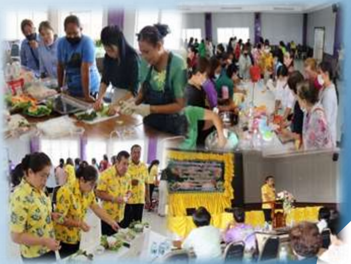
➤ โครงการส่งเสริมการดำเนินชีวิตตามหลักปรัชญาของเศรษฐกิจพอเพียง