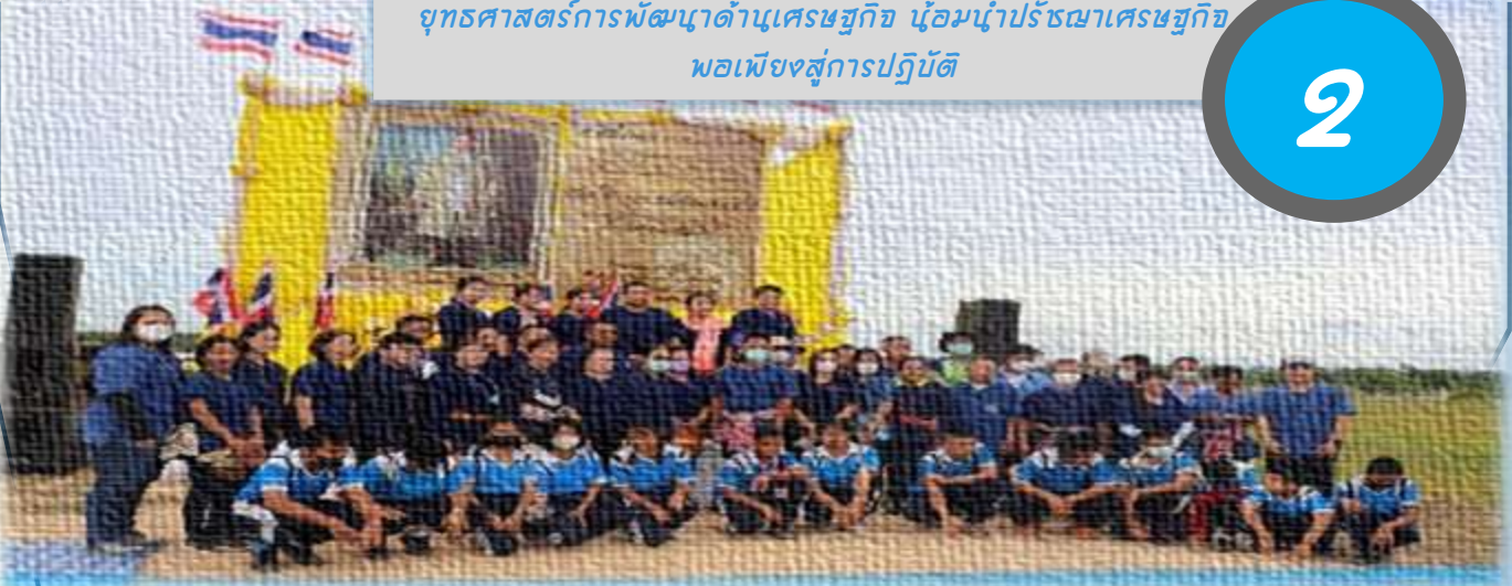
➤ โครงการอนุรักษ์และพัฒนาควายไทย