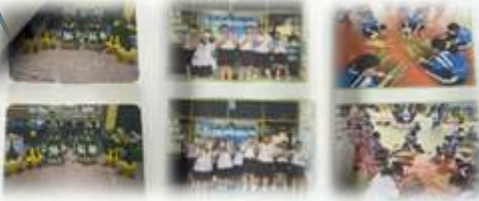
➤ โครงการพัฒนาและส่งเสริมภูมิปัญญาท้องถิ่น