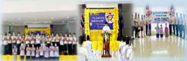
➤ โครงการประกวดคำขวัญต่อต้านการทุจริต