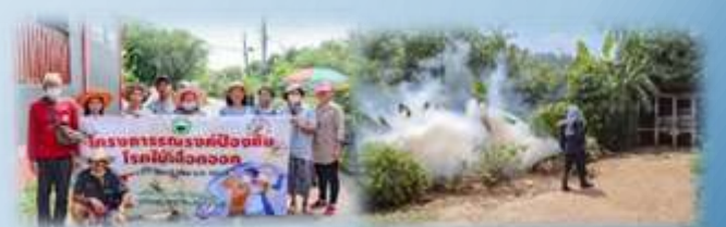
➢ โครงการรณรงค์ป้องกันโรคไข้เลือดออก