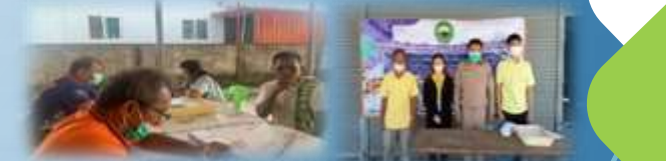
➢ โครงการสำรวจจำนวนและชี้แนะเบี่ยงนุสนุ้ย และแนว