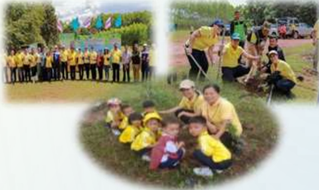
➤ โครงการรักน้ำ รักป่า รักแผ่นดิน