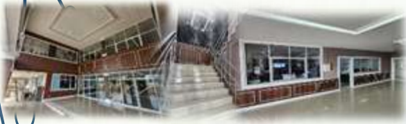
➤ โครงการปรับปรุงอาคารอเนกประสงค์ อบต.เมืองเก่า