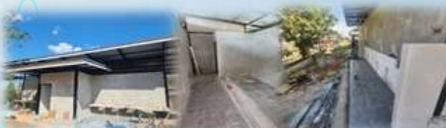
➢ โครงการก่อสร้างห้องน้ำ สาธารณะที่ทำการ อบต.เมืองเก่า