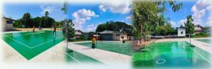
➤ โครงการก่อสร้างลานกีฬาอเนกประสงค์บ้านเสียบ หมู่ที่ 22