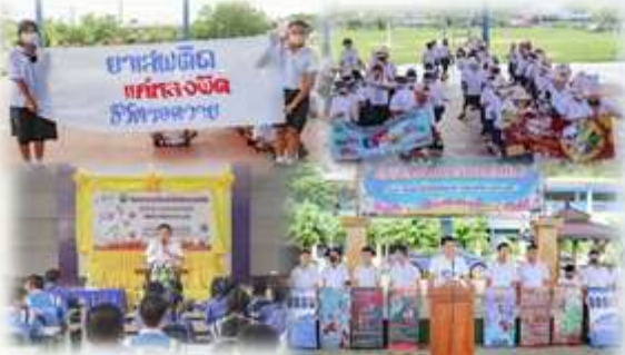
➢ โครงการคนเมืองเก่าห่างไกลยาเสพติด