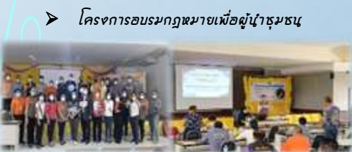
➤ โครงการอบรมกฎหมายเพื่อผู้นำชุมชน