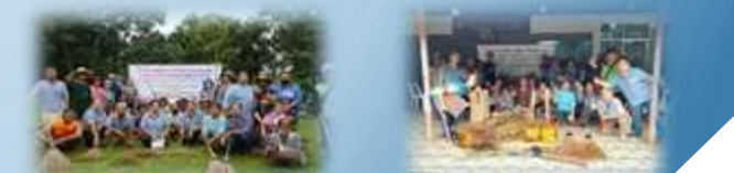
➢ ยุทธนะโครงการพระราชดำริด้านสาธารณสุข ตำบลเมืองเก่า