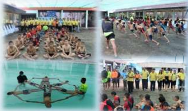
➢ โครงการฝึกอบรมป้องกันเด็กขมขื่น