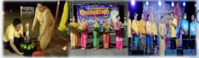
➤ ยุทธนะโครงการงานประเพณีลอยกระทง