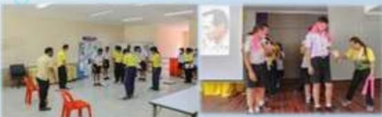
➤ โครงการปกป้องสถาบันสำคัญของชาติ