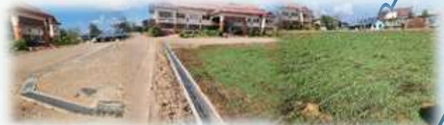
➤ โครงการปรับปรุงภูมิทัศน์ที่ทำการ อบต.เมืองเก่า