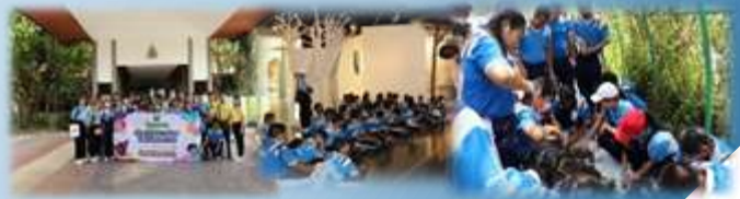
➤ โครงการสร้างภูมิคุ้มกันทางสังคมให้แก่เด็กและเยาวชน