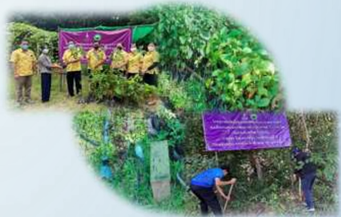
➤ โครงการอนุรักษ์พันธุ์กรรมพืช (อน.สธ.)