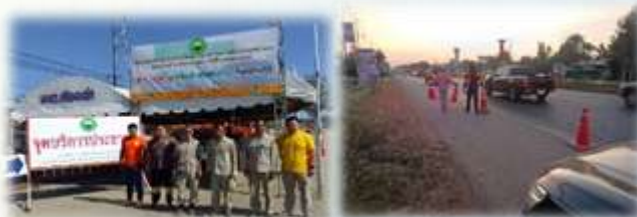
➢ โครงการเฝ้าระวังและป้องกันอุบัติเหตุทางถนนช่วงเทศกาลปีใหม่