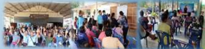
➤ โครงการอบรมคุณธรรมและจริยธรรมแก่ผู้บริหาร สมาชิกสภาฯ พนักงานส่วนตำบล ลูกจ้าง