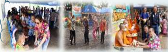
➤ ยุทธนะโครงการงานประเพณีสงกรานต์