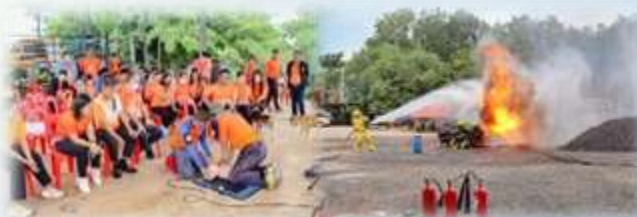
➢ โครงการพัฒนาประสิทธิภาพ ด้านการป้องกันและบรรเทาสาธารณภัย