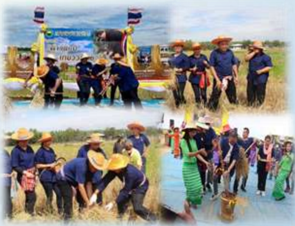
➤ โครงการดำวันแม่เกี่ยววันพ่อ