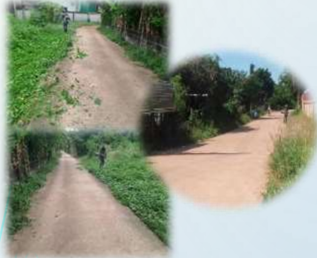
➤ โครงการ เมืองเก่าเมืองสะอาด